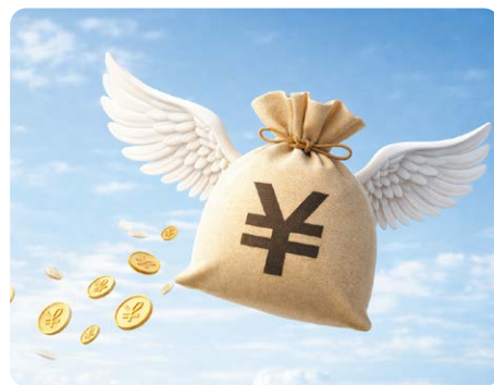
怠ると過料の可能性

名義や相続の状況を整理し、生前贈与や遺言書も視野に入れながら、家族で話し合うことが大切です。七色ほっとサポートでは、専門家が連携して対応できる体制を整えているため、「何から始めればいいのか分からない」方も安心です。