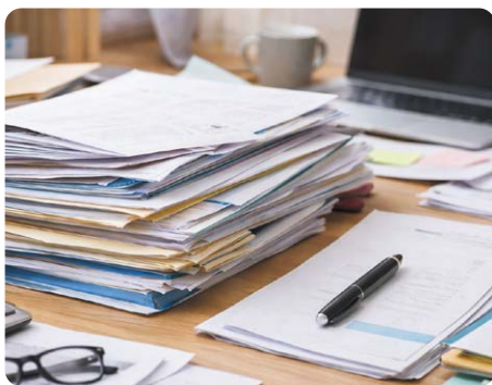
氏名・住所変更登記も義務化