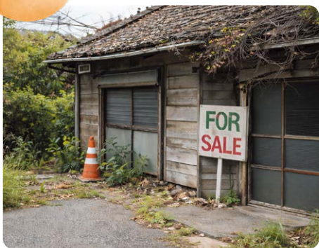
過去の相続も対象